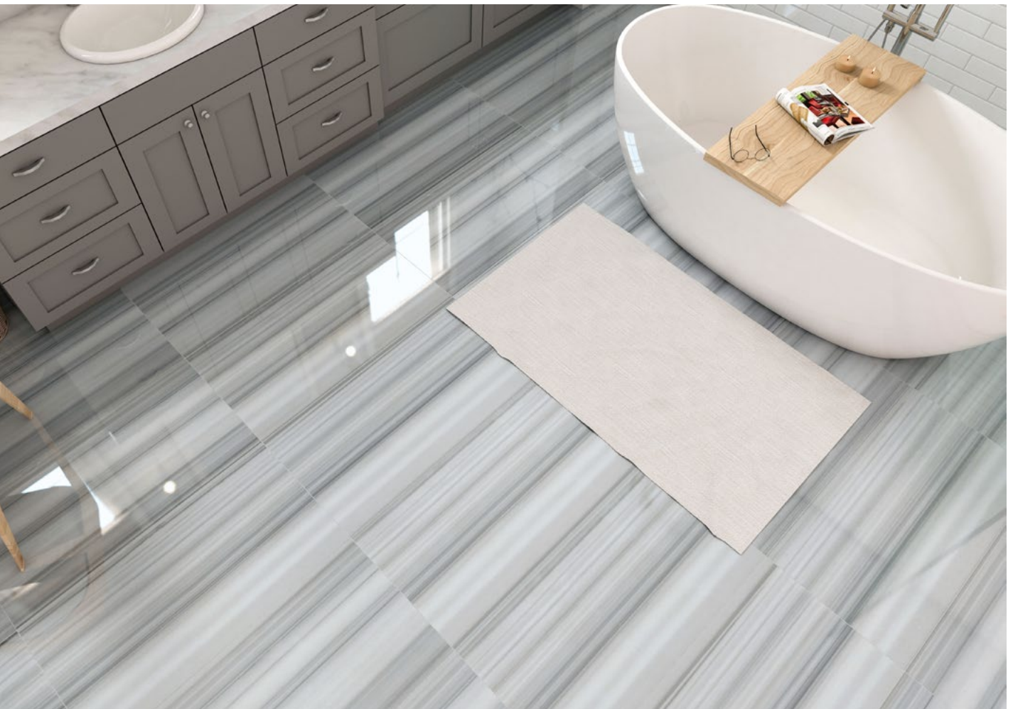
Milano 45 x 91 cm