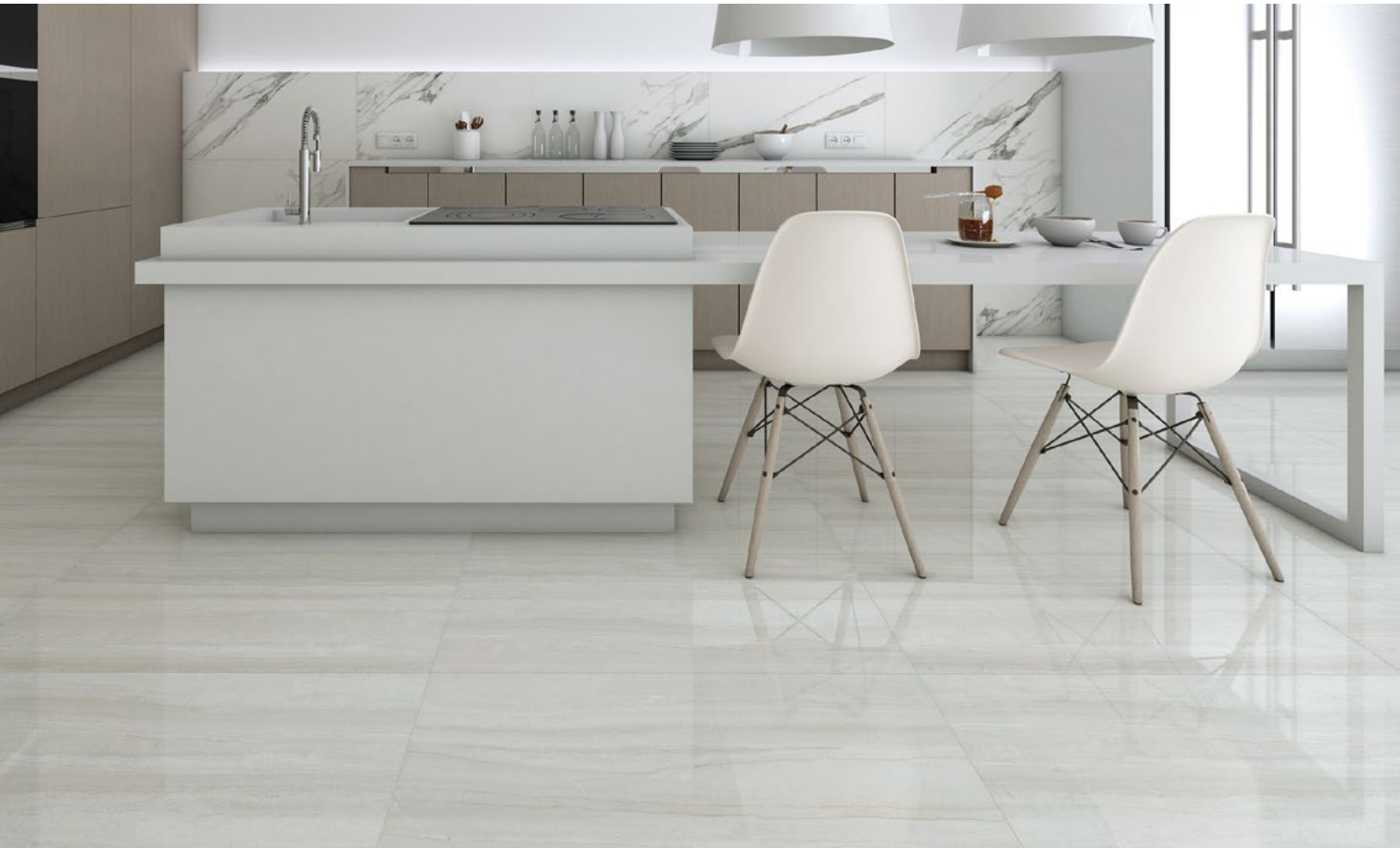
Moncler 45 x 91 cm