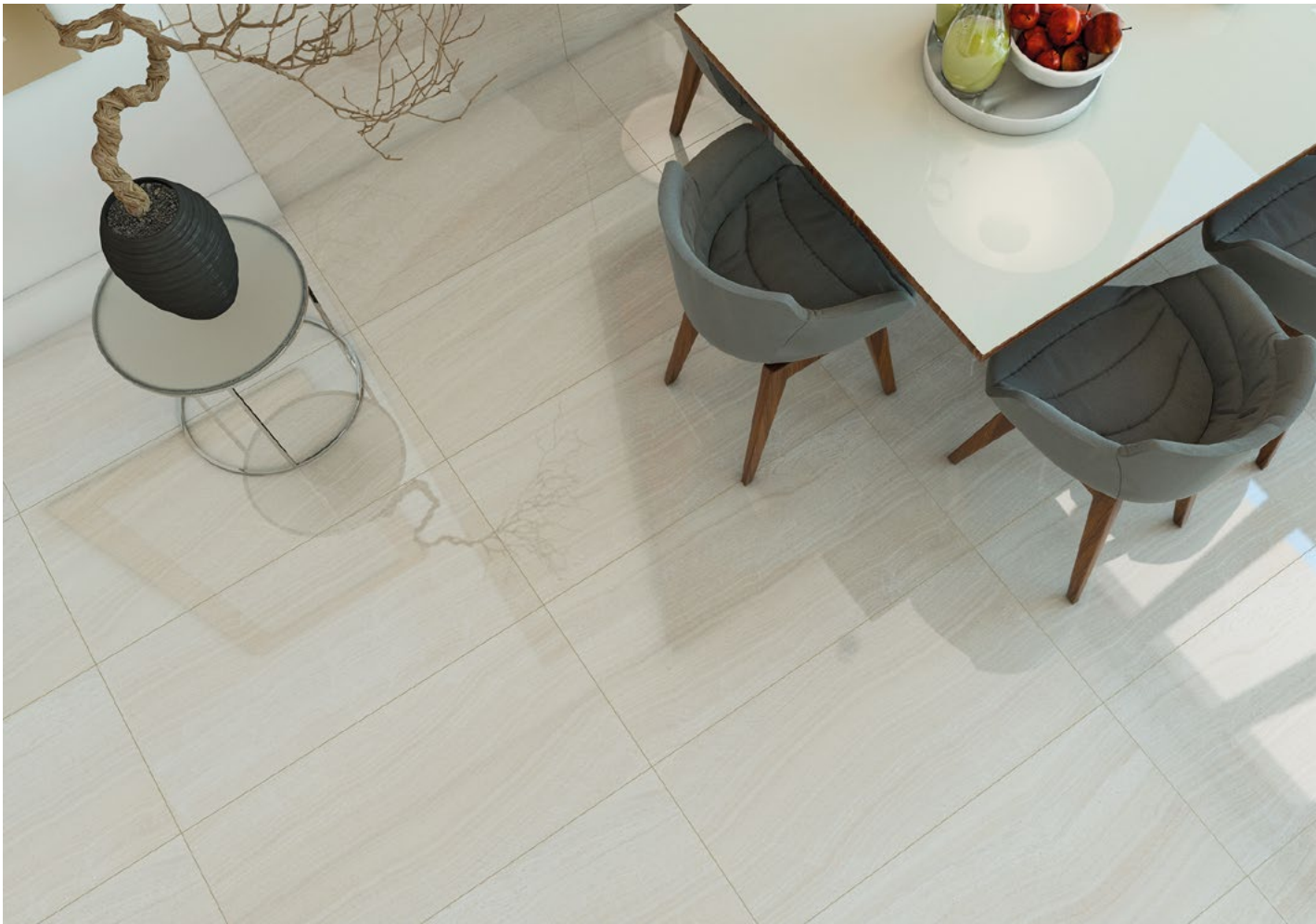
Rochelle Toscano 45 x 91 cm