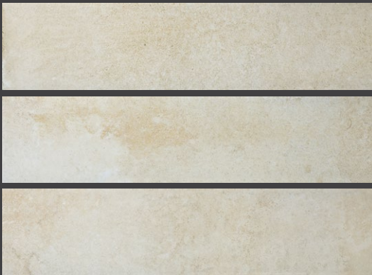
Beige GPF7 20 X 90 cm.