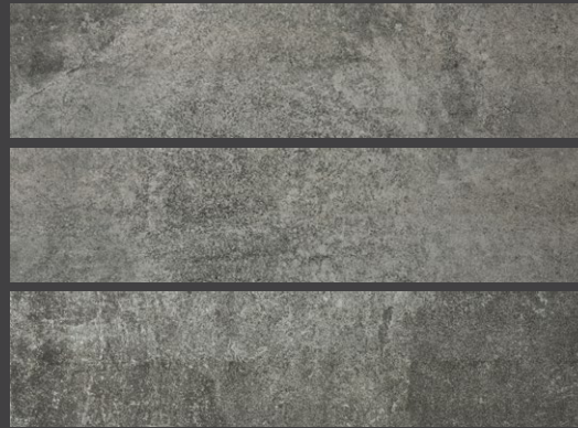
Old Grey GPF9 20 X 90 cm.