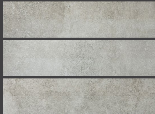
Grey GPF8 20 X 90 cm.