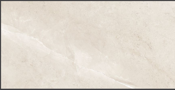
Cream ZMR5 59 X 118 cm rectificado