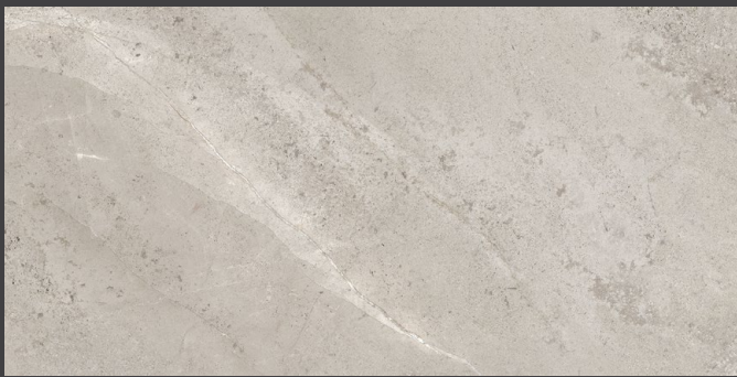
Gray ZMR6 59 X 118 cm rectificado