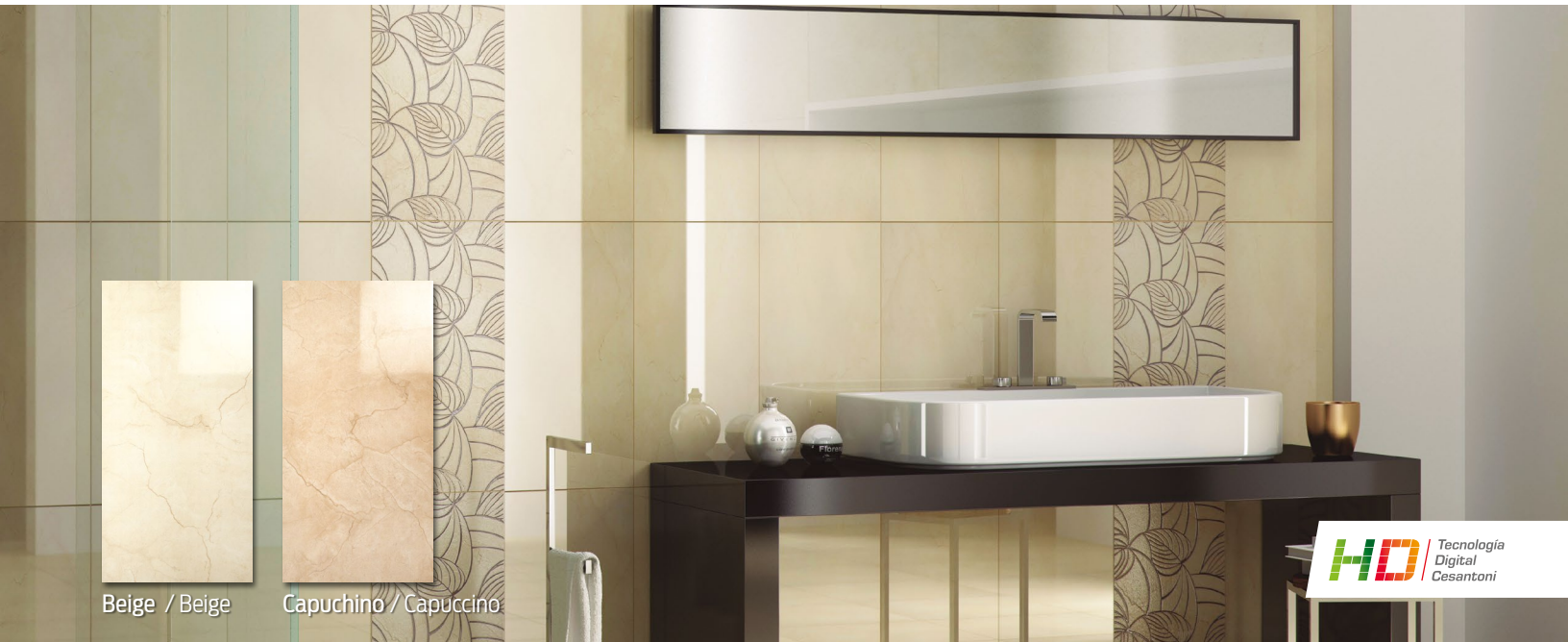
Beige / Beige