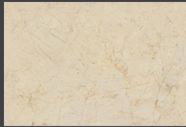
Ivory ZDO6 30 X 45 cm