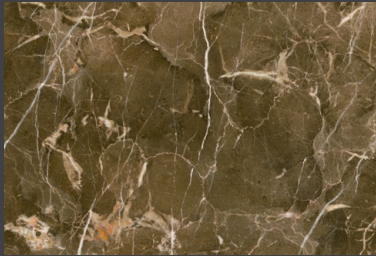
Café ZDO8 30 X 45 cm