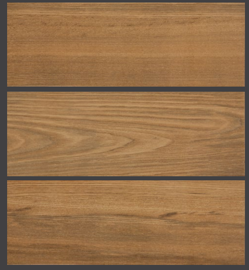
CEREZO ZCS3 18 X 50 cm