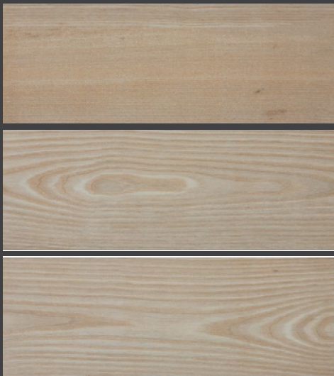
NATURAL ZCS1 18 X 50 cm