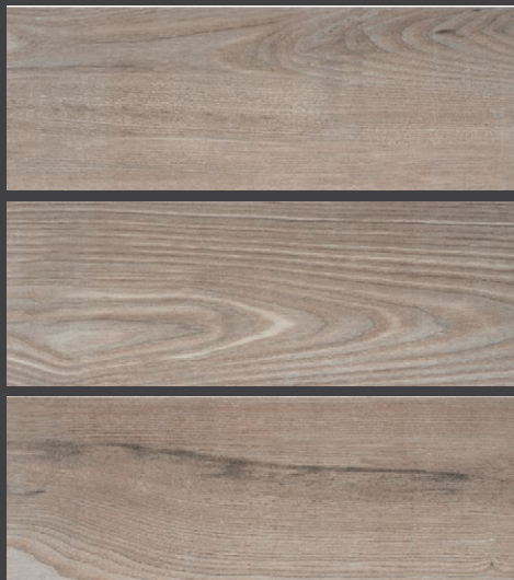
CASTAÑO ZCS2 18 X 50 cm