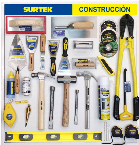
TCON1 (Una tabla)