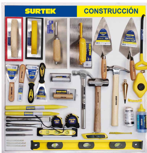
TCON2 (Dos tablas)